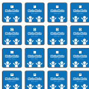
各プレイヤーのカード配置